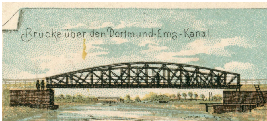
Brücke über den Dortmund-Ems-Kanal auf einer Postkarte um 1900.